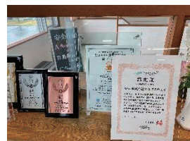
当社最大の長野センター

人身にかかわる重大事故の原因となる居眠り・意識障害・過労運転の防止に特に重点を置き、日々ドライバー全員の睡眠時間の確認、健康診断100%受診や、要所見者のフォローアップなど基本的な活動を徹底するとともに、脳ドックや禁煙外来受診料の個人負担を無くす制度を構築し、従業員の健康志向を高める取り組みをしています。さらにアクサ生命保険様からは、当社独自の取り組みではカバーしきれっていなかった生活習慣病予防に関するサポートパッケージを提供いただき、より広範な施策を打てるようになったと感じております。これからも当社の理念である「安全は信頼を創る」を実現し、社業を持続可能なものにしていくために、健康経営優良法人に積極的に取り組んでいこうと考えております。そして、社長の「自分の仕事に自信と誇りを持つ」の想いは、従業員が健康な身体と心を持つことにより実現できるものと信じています。